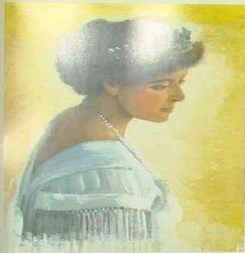
Regina Maria (n. 1873 - m. 1938)