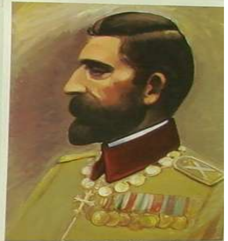
Regele Ferdinand (1914 - 1927)