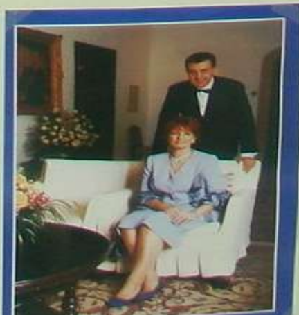
Principesa Margareta Principele Radu