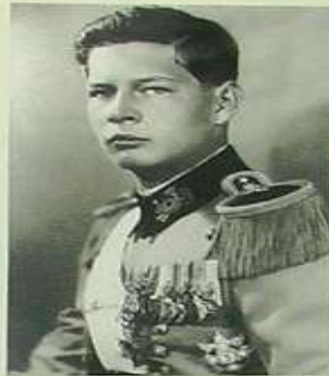
Regele Mihai I